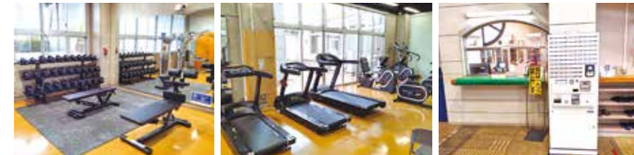
ダンベル(1kg~20kg) トレッドミル(リニューアル) 券売機(キャッシュレス対応)

受付横に券売機を設置し、現金またはキャッシュレスで精算ができるようになりました!(窓口でのカード決済も可能) また、トレーニング室をリニューアルしました!