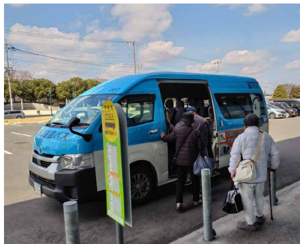
公共交通整備事業