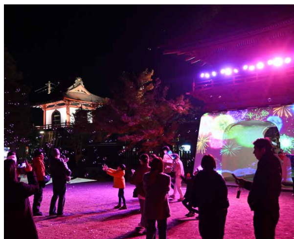
観光情報発信事業