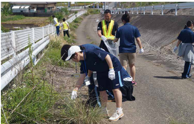
環境美化パートナーシップ事業