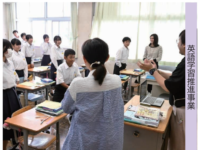
英語学習推進事業

第6次結城市総合計画後期基本計画の体系別計画のうち、 基本目標1 [保健・福祉] 、 基本目標2 [都市・環境] 、 基本目標3 [産業・観光] 、 基本目標4 [教育・文化] については、基本施策ごとに「現状と課題」、「基本的方針」、「基本施策の主な指標」、「施策体系・施策が目指す姿」、「個別施策・主要事業」を整理するとともに、主要事業ごとに指標を設定しています。