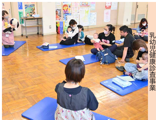
乳幼児健康診査事業