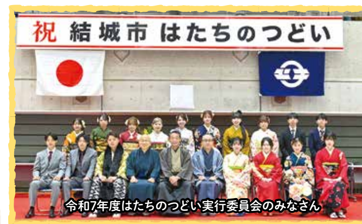
令和7年度はたちのつどい実行委員会のみなさん