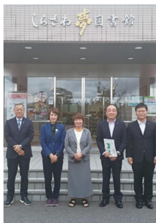
本宮市しらさわ夢図書館にて

プリンスウイリアムズパークについて しらさわ夢図書館の取組について 高齢者への交通支援について