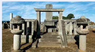
万松寺跡にある水野越前守忠邦の墓（県指定史跡）

1855年、万松寺は火災により消失しますが、現在でも山川水野家の歴代の墓所が、その地に残されています。