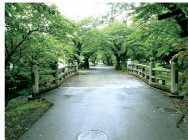
城跡歴史公園の南側に現存する「みかつき橋」

【広報結城2月号の訂正】 画像の紹介文にて、以下の誤表記がありました。お詫びして訂正いたします。 誤 孝顕寺 正 孝顕寺