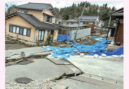
現地の被災状況の様子