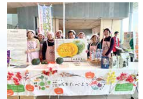
カボチャ団子を配布(祭りゆうき2023)