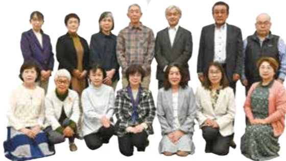
市社会福祉課 企画管理係 ☎ 34-0416