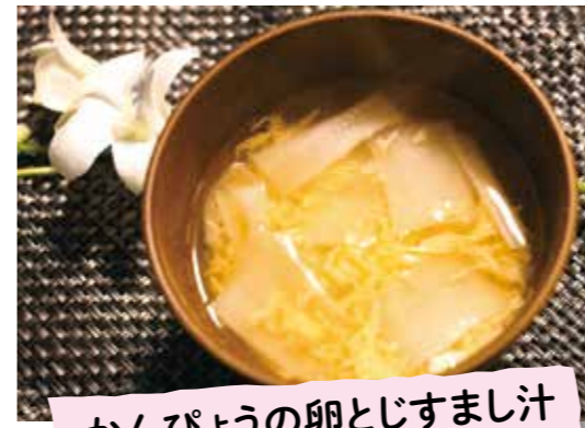
かんぴょうの卵とじすまし汁

令和元年に開催した「いきいき茨城ゆめ国体(茨城国体・第74回国民体育大会)」の結城市会場で、結城市食生活改善推進協議会の協力により、おもてなし料理としてすいとんを加え、大会参加者に提供しました。