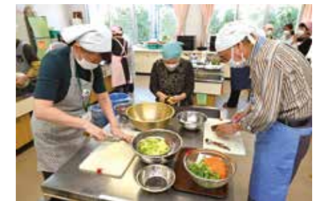
食改養成講習会でスープカレーを調理

食生活改善推進員は、食による地域の健康づくりを活動目的とした「食生活を改善する人」のことで、「食改さん」とよく呼ばれています。昭和57年に活動を開始し、昨年40周年を迎えました。現在は31名で活動しています。 「私たちの健康は私たちの手で」をスローガンに、家族、そして、「お隣さん、お向かいさんへ」と地域ぐるみで、バランスのとれたよりよい食習慣をつくっていくことを目指しています。私たちと一緒に活動してみませんか。ご希望の方は、健康増進課までご連絡ください。