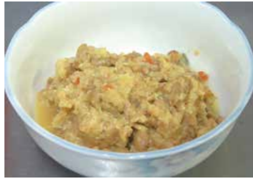
すみつかれ(しもつかれ)

結城市(旧下総国)は、栃木県(旧下野国)や筑西市(旧常陸国)と接しており、古くから近隣地域の食文化の影響を受けています。その代表が、「すみつかれ(しもつかれ)」です。