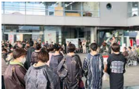
11/11・12開催の「きものday結城」

ご希望に沿うツアーを提案しますので、お気軽にお問い合わせいただくと幸いです(参加条件などありません!)