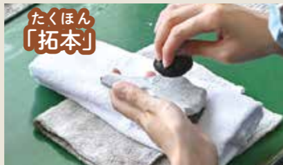
遺物に紙を巻き、インクを押し付けて表面の模様や記号などを写し取ります。

結城廃寺跡の遺物は学術的にも貴重なものばかり。その特徴や記録をしっかり後世に残せるよう、丁寧に作業しています。