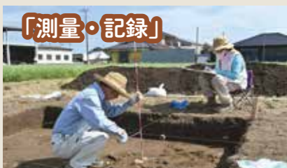
遺物が出土した場所や様子を測り、図面に記録していきます。