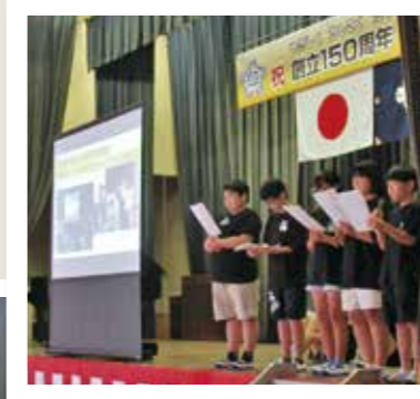
今年度の発表会の様子