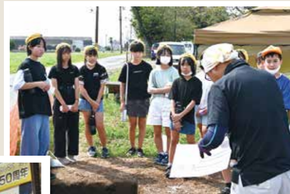
担当者の説明に熱心に聞き入る6年生

同校では毎年度末に、6年生から5年生へ結城廃寺跡の学習についての「引継ぎ式」を行っており、子どもたちの“学びのバトン”が脈々とつながっています。今年度の発表会は、10月の「創立150周年記念式典」で行われました。これまで学んだことを紹介するだけでなく、「授業参観で結城廃寺跡の発表をする」「新聞を作り地域の人たちに配る」など、もっと知ってもらうためのアイデアも提案した6年生。在校生や保護者、地域住民など多くの参加者を前に堂々と発表しました。