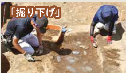
土を手作業で掘り下げ、遺物を検出します。