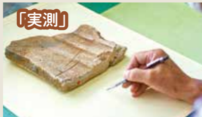
大きさや天地などを計測し、方眼紙上に記録していきます。