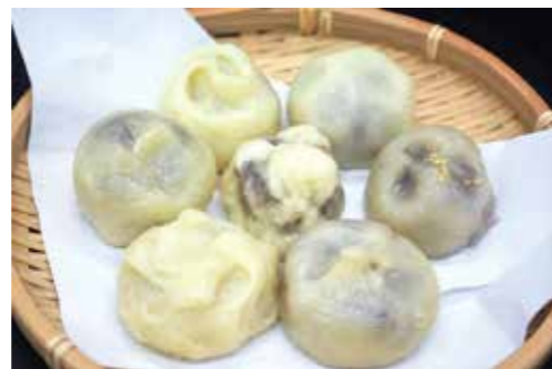
市生涯学習課 文化係 ☎32-1931