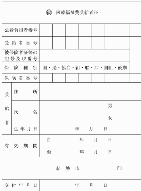
様式第2号(第4条関係)