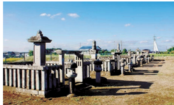
山川水野家墓所(山川新宿地内) 問 市生涯学習課 文化係 ☎32-1931

山川の地を去った後、駿河国(静岡県)や三河国(愛知県)、肥前国(佐賀県)などへ転封をしますが、歴代当主たちは万松寺を菩提寺としました。建物は江戸時代末期に焼失しましたが、現在も墓石が残り、近世大名の姿を垣間見ることができます。