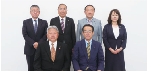
▲教育・福祉委員会