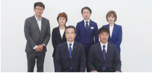
▲産業・建設委員会