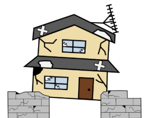
※対象となる空家等の例