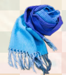
ショール 「一年中ショール」