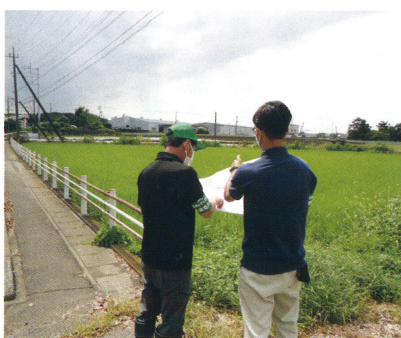
利用状況調査の様子