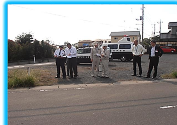
合同点検実施状況