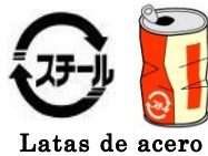
Latas de acero