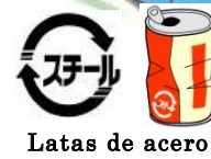
Latas de acero