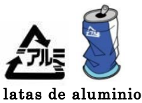
latas de aluminio