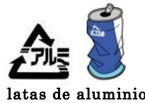
latas de aluminio