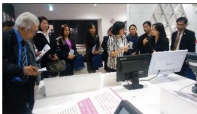
サイエンススクエアにて