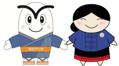
「まゆげった」とメーサイ市キャラクターの「タイユアン」