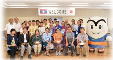
ホームステイの皆さんと

高校生の皆さんは 19 日に前場市長表敬訪問を行い、24 日まで市内でホームステイをしながら交流・体験活動を行いました。22 日には、筑波国際交流センター（JICA）において、開催された育てる会 20 周年記念式典に参加しました。