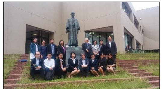
筑波大 嘉納治五郎像前

タイ王国教育省（教育省基礎教育委員会）の幹部職員 10 名が 9 月 19 日来日し、本市を表敬訪問、20 日には筑波学園都市の研究施設を視察しました。一行は、最先端の科学技術や日本最大規模の宇宙航空開発施設の一部を熱心に見学されました。