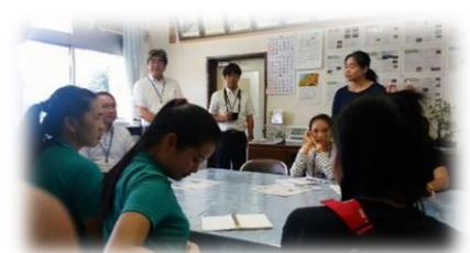
結城南中学校訪問