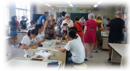
結城東中学校訪問