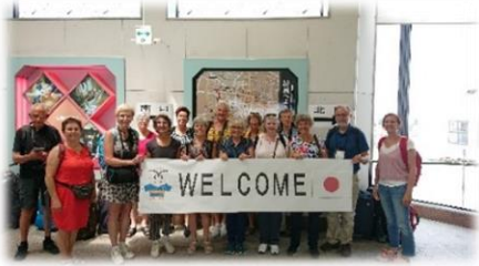
結城駅にてお出迎え

視察団は、市内の小中学校・結城蔵美館・ゆうき図書館等を訪問し、本市の教育・文化を視察しました。また、小学生と給食を共にし、身振り手振りを踏まえながら、会話が弾み、楽しい給食となりました。