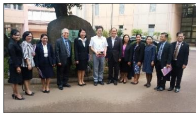
並木中等教育学校 玄関前