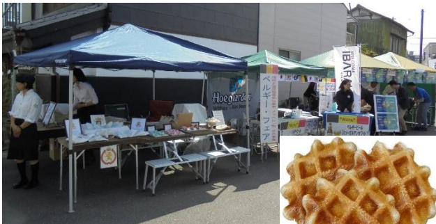
昨年とは場所が変わります

平成28年の天皇皇后両陛下並びにベルギー国王王妃両陛下の来結を記念したベルギーワッフル。今年も、アルチザンのイタバシシェフが、素材にこだわり焼き上げたリエージュワッフルをお届けします。