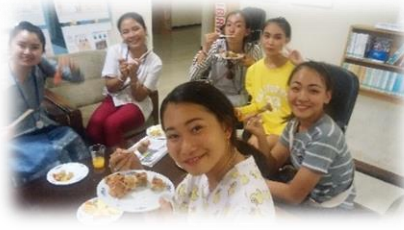
式典の大役を終えて一息