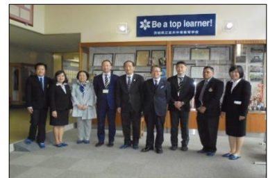
並木高校訪問(つくば市)