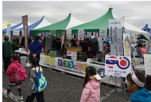
淹れたてのドイトンコーヒーは絶品！

メーサイ市および交流のきっかけとなったドイトンプロジェクトのPRを行います。 日本では、結城市でしか味わえないドイトンコーヒーをお楽しみください！