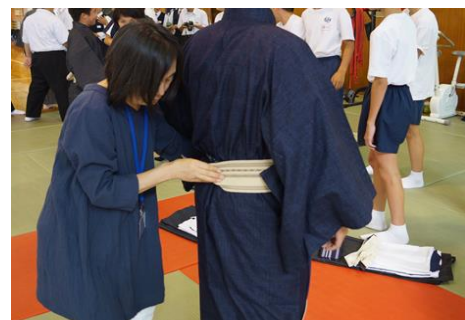
帯締め（締めてもらう人との呼吸を上手に合わせて）