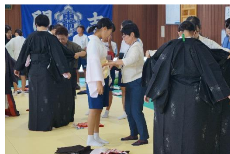
襟・裾合わせをする