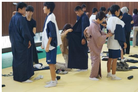
肌襦袢を身に着ける