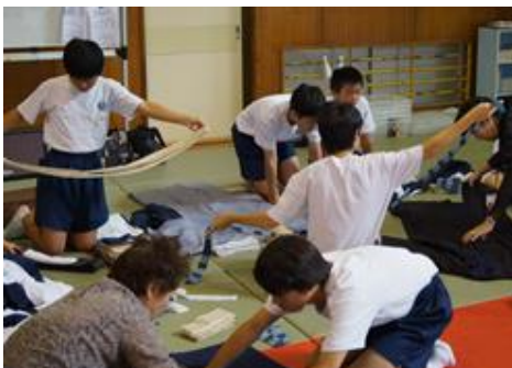
襟・襟先合わせ～脇縫いあわせ～ 体験者は全員、心を込めて着物をたたんでいました。