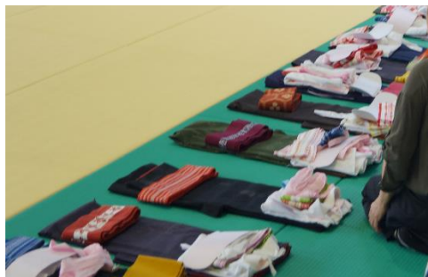
好きな組み合わせを選択

市内 3 中学校で、結城紬を着用する「着心地体験」が行われ、初めての体験に緊張気味の子どもたち。いつしか背筋が伸びて、紳士・淑女になってポーズ！