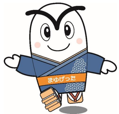
結城市マスコットキャラクター 「まゆげった」