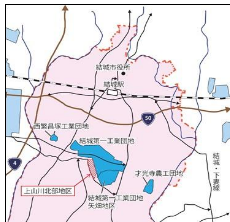
工業地ゾーンへの編入区域図