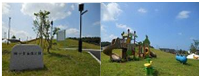
毎月1回 ふれあい館やわくわく山公園の清掃実施

本会は、会員相互の連携と親睦を図るとともに、市行政と連携・協力し合って、明るい住みよいまちづくりの推進と地域社会の発展に寄与することを目的に活動をしています。