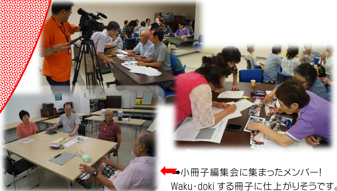
←小冊子編集会に集まったメンバー! Waku・doki する冊子に仕上がりそうです。

◆上の2ページの構成の違いがわかりますか? 「文字に変化を加えたり,写真の角度を変えたりすると効果的ですね。簡単な線描キイラストを加えるとさらにイメージアップできます。」土山氏からのアドバイスに一同納得!