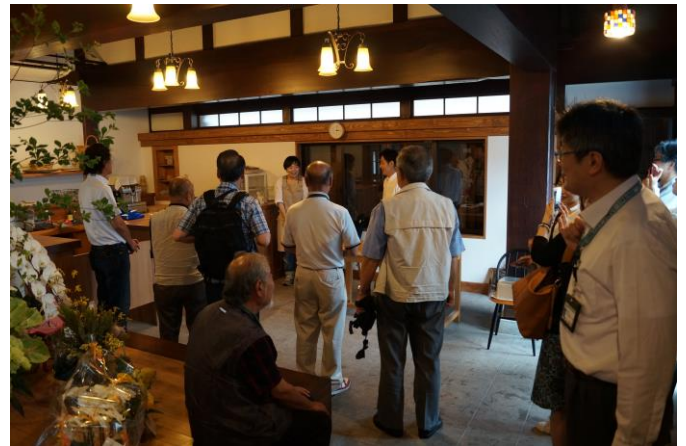
「ぱんや ムムス」(旧黒川米穀店)