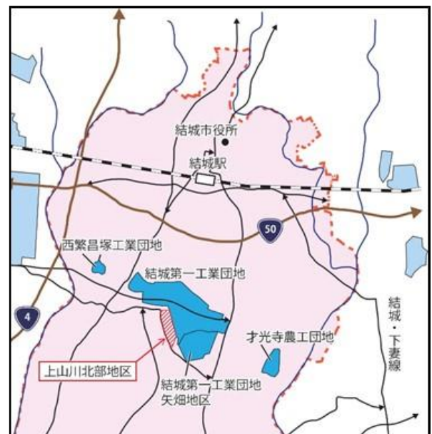
結城第一工業団地上山川北部地区位置図