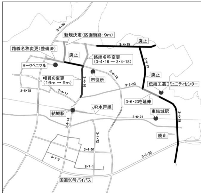
都市計画道路変更案