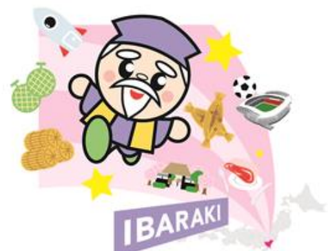
茨城県マスコットキャラクター ハッスル黄門