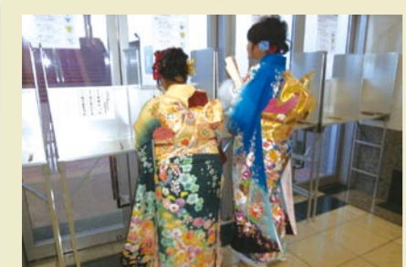
若年層の意見も計画に反映