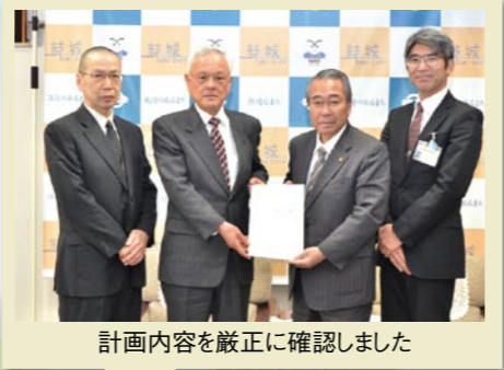
計画内容を厳正に確認しました