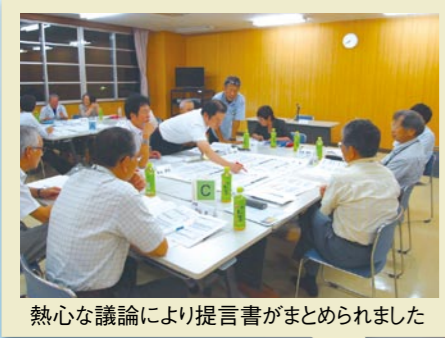
パブリックコメント

後期基本計画は、市民意向調査(市民3,000人アンケート)、新成人アンケート、策定市民会議、新成人模擬選挙、パブリックコメントなど、さまざまな形で市民の声を反映しています。特に策定市民会議では、分野ごとに3つのグループを組み、これからの結城市について真剣に話し合いを行い、「提案プロジェクト」をとりまとめました。また、総合計画審議会や市（策定委員会など）においても多くの議論を重ね、市民の皆さんと協働で策定しました。