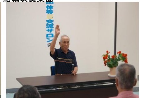
まちづくり研究会