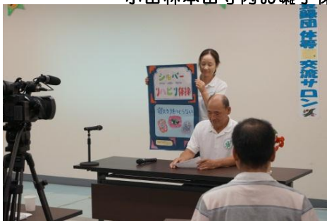
いきいきヘルス体操