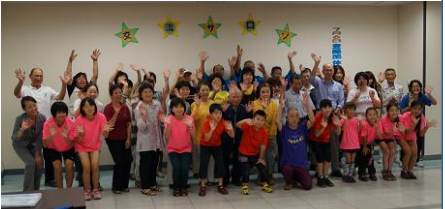
「いっせーのせー!!」 参加者全員声を合わせ、とっておきの笑顔でPR!