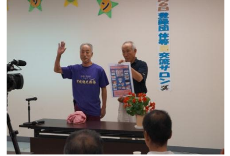
結城市民劇をつくる会