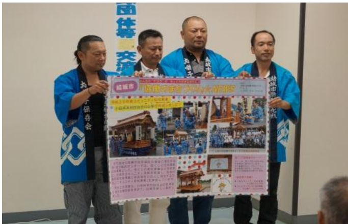
小田林本田寺内お囃子保存会