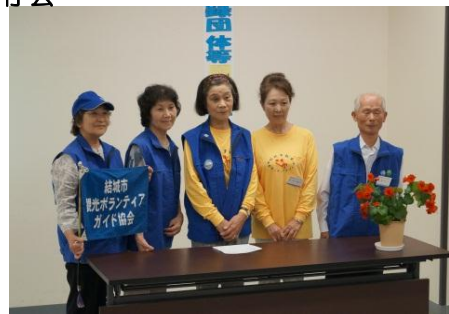
観光ボランティアガイド協会