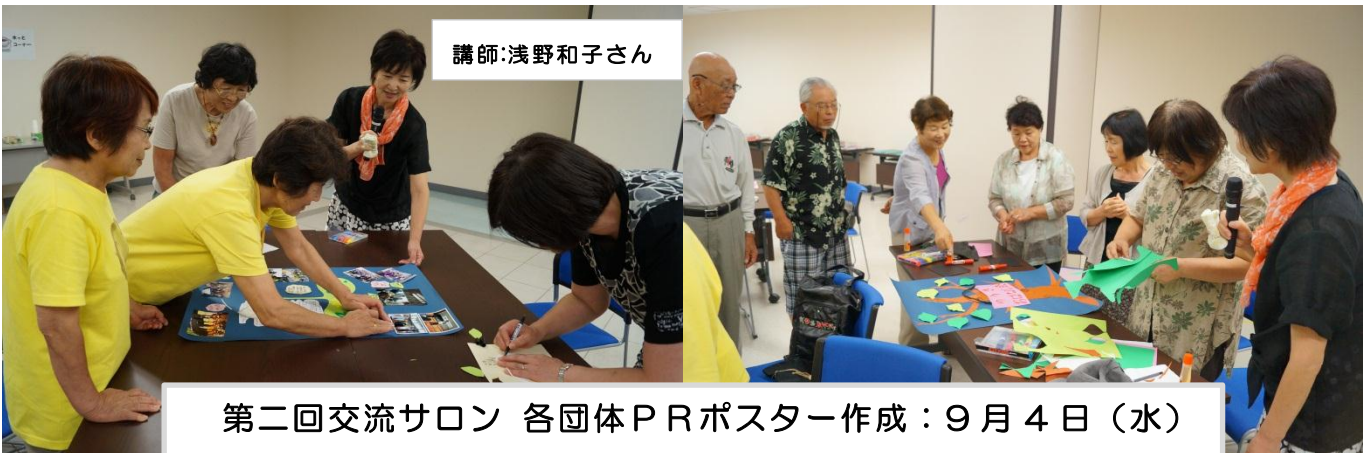
第二回交流サロン 各団体PRポスター作成：9月4日（水）

アイスブレイクの後には、緊張もほぐれて笑顔で互いの名前交換や団体紹介を行いました。