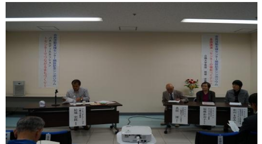
『センター機能ってナニ?』