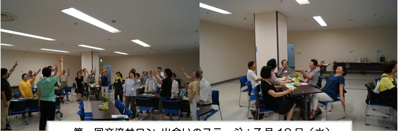
第一回交流サロン 出会いのステージ：7月10日（水）

市民活動を行っている団体等が、お互いの活動の情報交換をすることで、団体間の情報の共有化を図り、連携や協力関係のきっかけづくりとなるよう実施いたします。