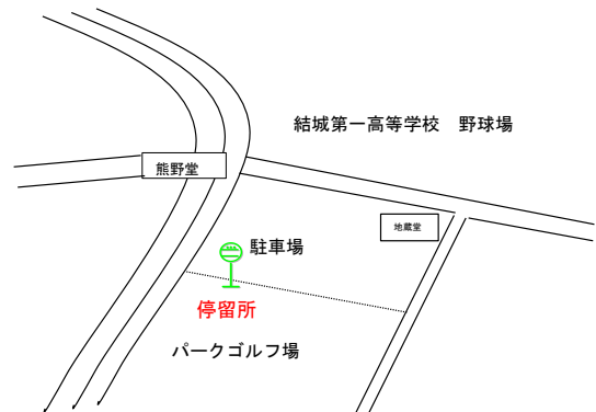
追加停留所位置図