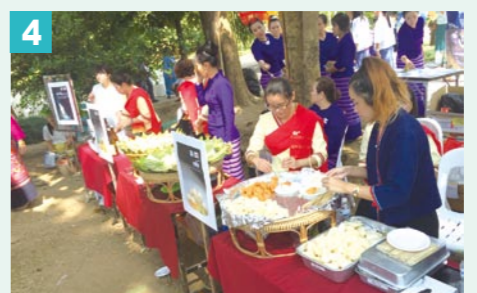
4 式典では、タイと日本の両方の料理が振る舞われた!お餅や豚汁、結城の梨など、みんな喜んでくれた。機会があれば、また行きたい!