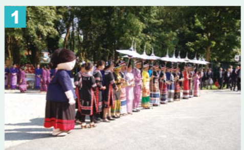
1 メーサイ市との国際親善姉妹都市盟約5周年の記念式典に参加するため、昨年の11月1日から7日までメーサイ市に行った。初めての海外!