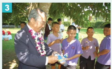
3 なんと、式典記念品として、ぼくのミニぬいぐるみが作られた!メーサイ市の子どもたちに配られた!今回だけの限定で非売品。