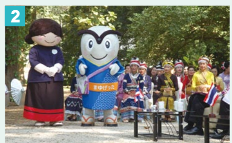
2 メーサイ市のキャラクター「タイアンちゃん」!一緒に式典に参加した!