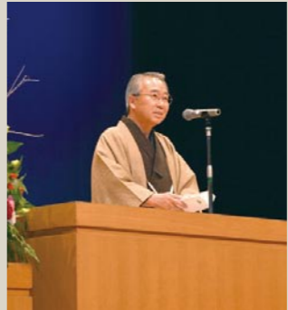
式辞を述べる前場市長