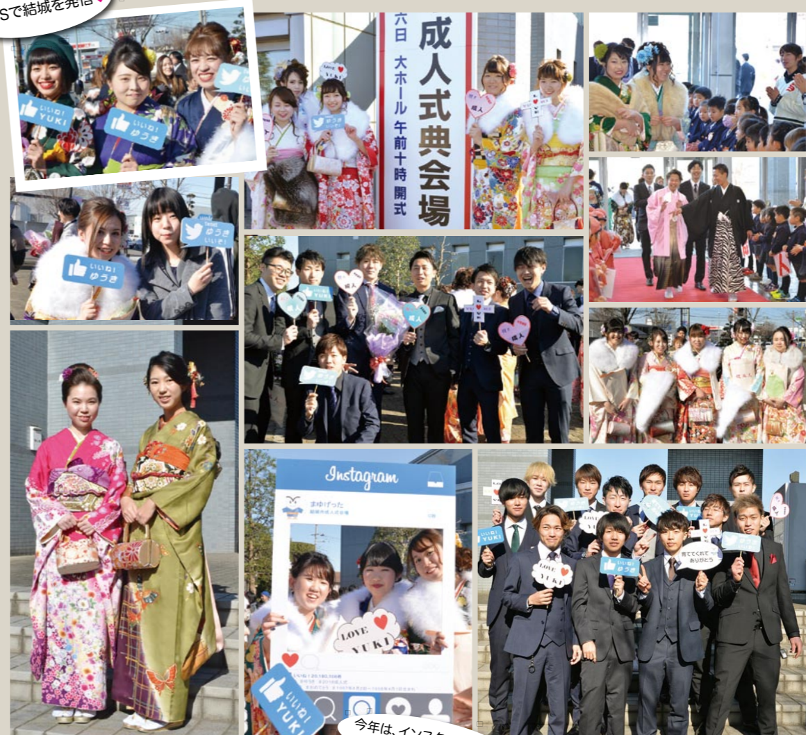
今年は、インスタフレームなども登場!