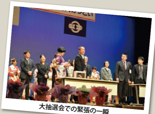
大抽選会での緊張の一瞬