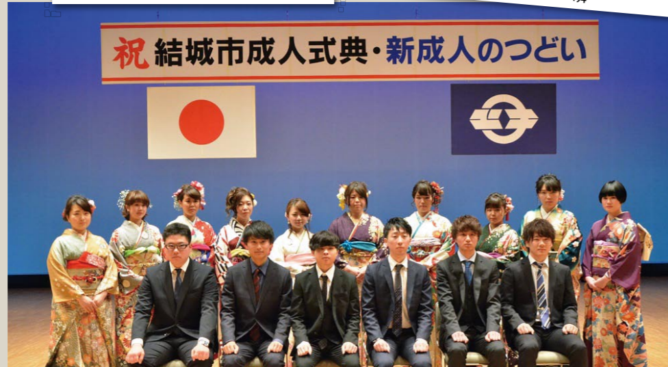
実行委員集合写真