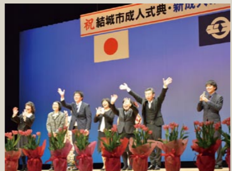
恩師たちによるお祝いの言葉

1 社会へ出ていくという自覚を持ち、大人として恥じぬよう生活していくことです。お世話になった人々に少しずつ、恩返しできたらいいなと思っています。 2 教師になることです。大学で学んだ知識に自分らしさをプラスして子ども達に慕われるような教師になりたいです。 3 伝統・歴史のある結城市なので、外国人にたくさん来てもらえるようなまちになってほしいです。日本人だけでなく、外国人にも人気のあるまちになることを願っています。