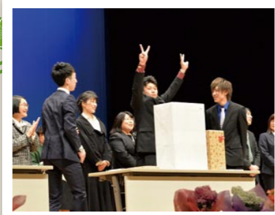
賞品獲得おめでとう

華やかな振袖姿で式典に出席した新成人の皆さん。今年は534人の皆さんが大人への仲間入りをしました。