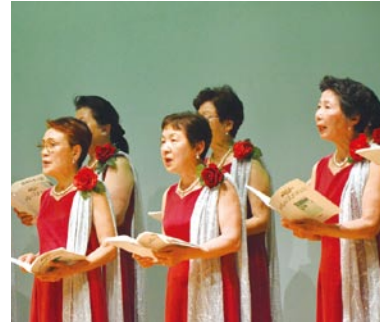
ゆづきエコー女声合唱団による合唱の様子

ゆづき市文化祭音楽部門 12月3日、市民文化センターアクロスで第52回ゆづき市文化祭音楽部門合同発表会が開催されました。参加者は、合唱や琴の演奏、ダンスなどさまざまなジャンルの音楽を楽しみました。