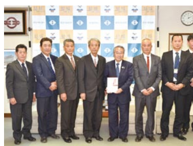
12月5日、前場市長に手渡されました

農業まつりでのチャリティ JA北つくば結城園芸部会より、11月に開催された農業まつりで集まったチャリティ68,010円を市に寄附いただきました。