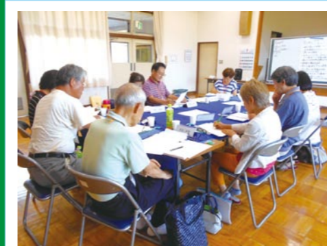
結城小学校区協議体 (すまいる結城)