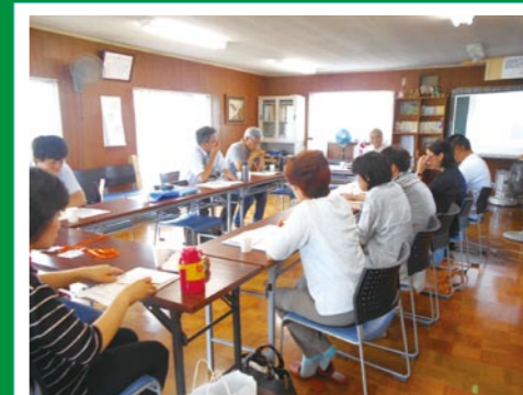
江川北・南小学校区協議体