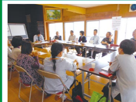
城南小学校区協議体 (城南元気会)