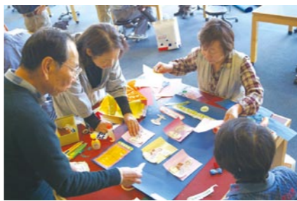
交流サロンのポスター作り

団体が取り組んでいる活動の事例としては、地域資源を題材とした自主的なイベントの開催や、福祉施設への慰問、独居老人に対する見守りや、高齢者向けに体操の指導を行うなど、それぞれが積極的な活動を行っています。これら登録団体に対し、本センターでは、交流事業の一環として「交流サロン」を実施しています。交流サロンは、団体が集まり