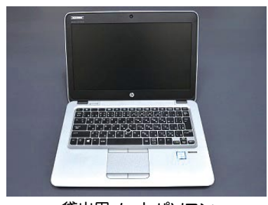
貸出用ノートパソコン

館1階カウンター前に展示しています。ぜひご覧ください。 ゆきき図書館利用案内その63 ノートパソコンの貸出について ゆきき図書館では、インターネットの閲覧用としてノートパソコンの貸出を行っています。使用時間の制限はありませんので、館内の資料と組み合わせインターネットを利用した調べ物などにご利用ください。 ※館外への持ち出しはできません。 ※ノートパソコンの貸出には、図書館利用カードが必要です。 ※ファイルリングソフトにより、一部見られないページもあります。