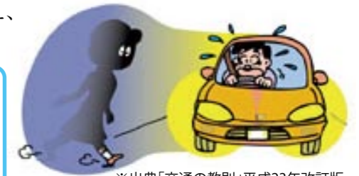
※出典「交通の教則」平成23年改訂版

ライトを下向きで走行中、歩行者などの発見が遅れ衝突する事故が目立ちます。 歩行者などを早く発見するため、対向車・先行者がいないときは上向きライトで走行してください。 また、ライトの特性(照射距離が左側に比べ右側が短い)を踏まえ、右からの横断者には特に注意をしてください。