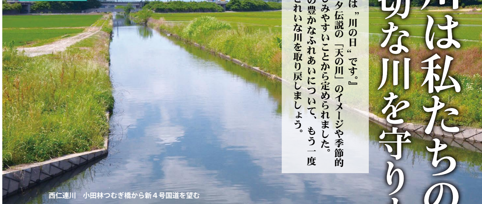
西仁連川 小田林つむぎ橋から新4号国道を望む