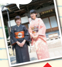
静けさに包まれます

結城の街には寺社が多く、結城家とともにまちづくりに関わってきた歴史がある。なかでも称名寺は初代藩主朝光のゆかりの寺として知られている。境内には親鸞の銅像もある。 称名寺 ▶P9