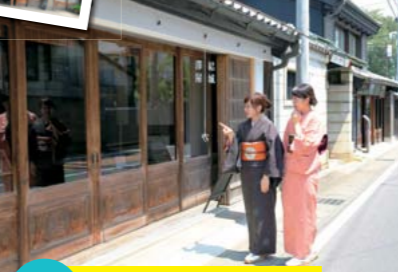
▲結城紬の老舗である奥順の着物が並ぶ(MAPS23C2)には美しい着物や帯

結城紬の卸問屋や商店が並ぶ大町通りは問屋街ともよばれ、古きよき時代の面影が色濃く残る。通りに立つ見世蔵は、現在でも地元の人たちの商売や生活の場として活用されている。