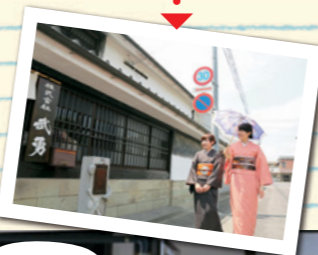
▲木の格子戸や漆喰の壁が趣ある蔵造り