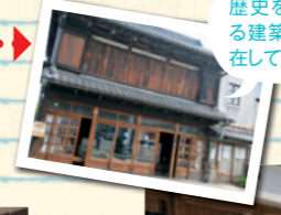
歴史を感じる建築が点在している

まずは結城蔵美術館で、市の歴史を学ぼう。日本の三大名槍「御手杵の槍」もここで見られる。地元作家の作品ギャラリーもあるので、こちらもぜひチェックして。 結城蔵美術館 ▶P8