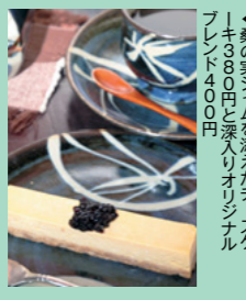
▲桑の美しさを生かしたチークスケーキ380円と深入りオリジナルブレンド400円

見世蔵を改築したカフェの店内は、和モダンでくつろげる雰囲気。ギャラリースペースでは結城紬の着物の展示や企画展を行っている。ランチのお弁当1080円～は予約をしよう。 ③結城市結城12-2 ④JR結城駅から徒歩10分 ⑤10～18時 ⑥火曜 ⑦20台