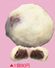
▲1個90円 甘き控えな餡を包む、むっちりとした皮も厚めで食べごたえアリ

●きくちかしてん ☎0296-32-4356 MAP P22B3 ③結城市結城7473 ゆうきしろくろーど1階 ④JR結城駅からすぐ ⑤10～20時 ⑥無休 ⑦300台