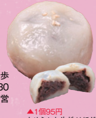
▲1個95円 なめらかな生地はほどよい厚さ。丁寧に炊きあげた餡は甘みがあさり

●なかかわ ☎0296-33-2301 MAP P22C2 ③結城市結城29 ④JR結城駅から徒歩10分 ⑤8時～19時30分 ⑥木曜 ⑦なし(市営駐車場利用)