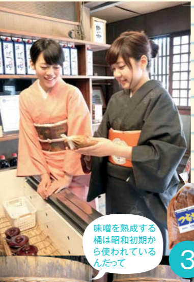
味噌を熟成する桶は昭和初期から使われているんだって