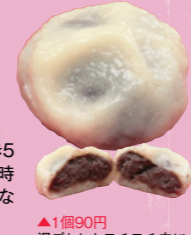
▲1個90円 湯ごねしたモチモチ皮に自家製粒餡がぎっしり。皮と餡のバランスが絶妙

●わがしどころ やまだや ☎0296-33-3606 MAP P22C2 ③結城市結城386 ④JR結城駅から徒歩5分 ⑤8時30分～18時30分 ⑥月曜不定休 ⑦なし(近隣駐車場利用)