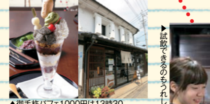
▲御手杵パフェ1000円は13時30分～16時限定のメニュー。風味豊かな抹茶わらび餅620円もおすすめ