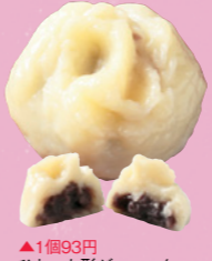
▲1個93円 ひねった形がユニーク。蒸した皮の食感とつぶ餡の上品な甘さがマッチ

●てづくりわがしどころ しんせいどう ☎0296-33-3645 MAP P22C2 ③結城市結城1362 ④JR結城駅から徒歩10分 ⑤8～19時 ⑥木曜(祝日の場合は営業) ⑦10台