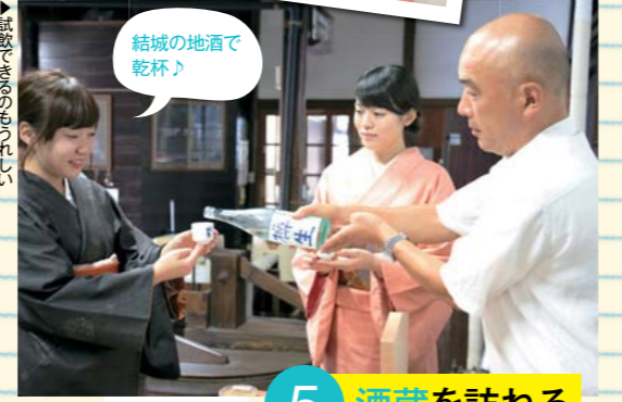
結城の地酒で乾杯♪