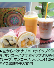
▲左からバナナチョコホイップ290円、マンゴーバナナホイップ310円、グレープ、マンゴースラッシュ410円、アイス黒糖ラテ390円

タイの麻薬撲滅を支援するプロジェクトに賛同して生まれたコーヒーショップ。タイのドイトン地区でケシの代替に栽培されているコーヒー豆を使用している。 ③結城市結城10745-24 城西病院1階 ④JR結城駅から車で5分 ⑤8時30分～17時(土曜は～15時) ⑥日曜、祝日 ⑦100台