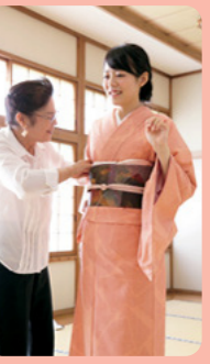
▲着付けの依頼は予約時にお願しよう