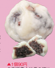
▲1個90円 北海道産大納言の餡は粒がしゃかりいてコクがあり、後引くおいしさ

●ふじみねかしほ ☎0296-33-2544 MAP P22C2 ③結城市結城78 ④JR結城駅から徒歩15分 ⑤8時～19時30分 ⑥木曜(祝日の場合は営業) ⑦4台