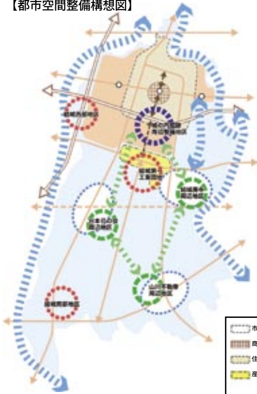
【都市空間整備構想図】

安全で住みやすさを実感できるまちづくりを進めることで、子どもから高齢者まで誰もが心豊かに健康で安心して暮らせる快適なまちを創造する。